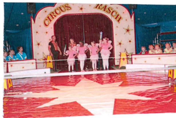
Leoni und Lena